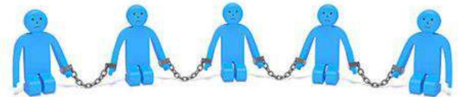
Masculinidade Tradicional Oprimida (MTD)