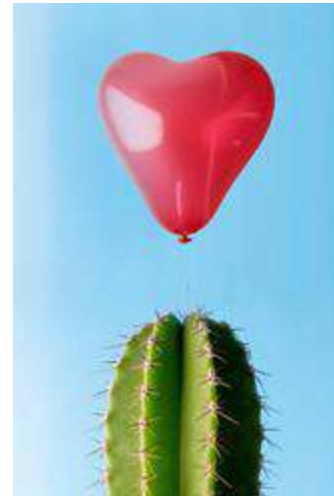
Coercive Dominant Discourse