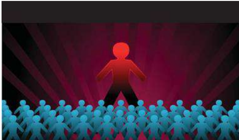
Dominerende, traditionelle maskulinitet (DTM)