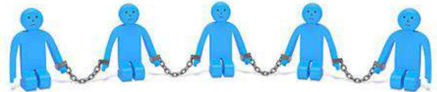
Den undertrykte, traditionelle maskulinitet (UTM)