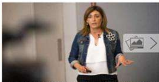
"Las denuncias de violencia escolar no las hacen los chivatos, sino los valientes"

-¿A partir de qué edad empiezan a manifestarse comportamientos violentos en los alumnos de los centros de enseñanza?