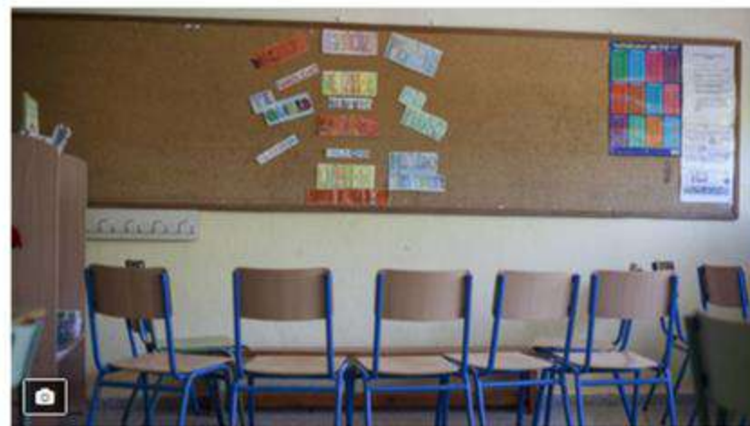
La vuelta al cole en las Tres Mil Viviendas de Sevilla

El colegio Andalucía, en el corazón de las Tres Mil Viviendas, lucha contra el absentismo y el analfabetismo en una barriada donde uno de cada tres niños se titula en Secundaria